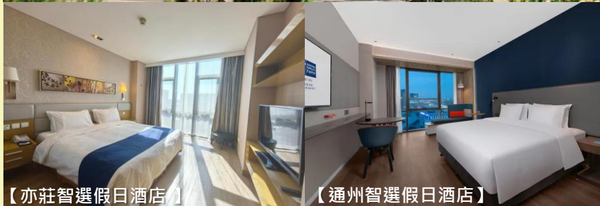
【亦莊智選假日酒店】