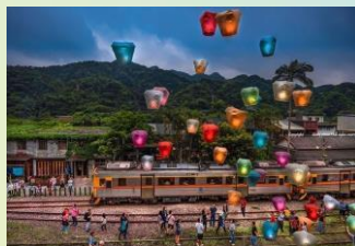
【菁桐火車站放天燈】

【菁桐老街】：菁桐老街，保留著全台最完整的礦業聚落風貌，斑駁的「石底煤礦選洗煤場」紅磚牆上，藤蔓正溫柔覆蓋著當年的工業傷痕。