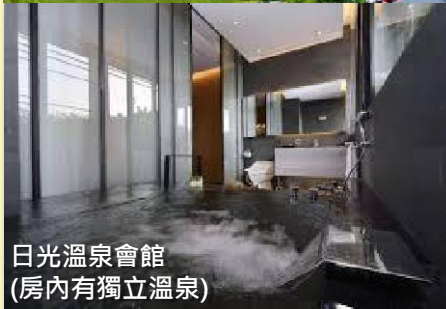
日光溫泉會館 (房內有獨立溫泉)