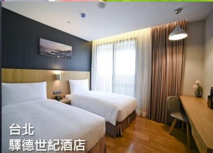
台北 驛德世紀酒店