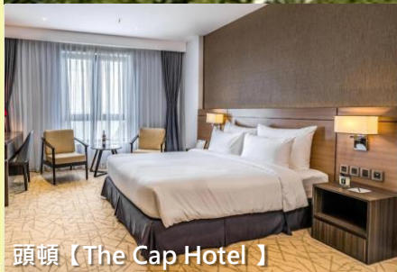
頭頓【The Cap Hotel】