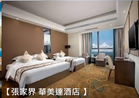
【張家界 華美達酒店】