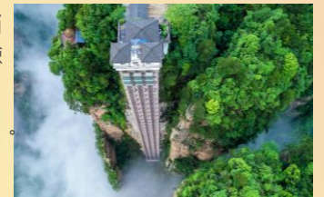
【張家界國家森林公園】

Day 04 張家界國家森林地質公園 > (*自費項目：天子山索道 ¥72) 天子山景區 > 乘環保車遊覽袁家界核心景區 (*自費項目：百龍天梯下山 ¥65) > 金鞭溪