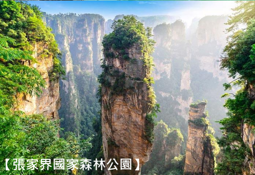
【張家界國家森林公園】