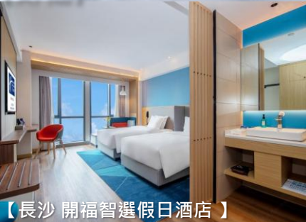
【長沙 開福智選假日酒店】