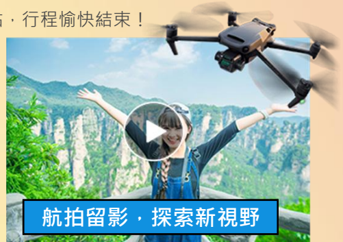
航拍留影, 探索新視野