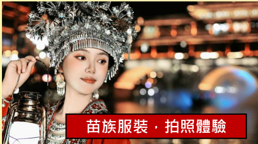
苗族服裝, 拍照體驗