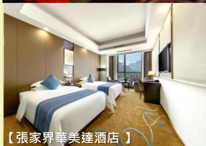
【張家界華美達酒店】