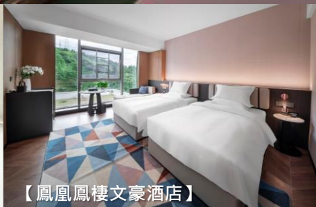
【鳳凰鳳樓文豪酒店】