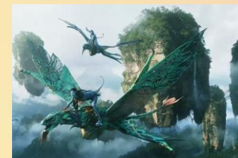
【袁家界】哈利路亞山

【自費方案-土司城、邊城茶峒 > 矮寨大橋景區】：土家人心中的聖地--【土司城】距今近三百年歷史，是西南地區唯一保存完好的古城。【邊城茶峒】“一腳踏三省”，沈從文先生把茶峒古鎮優美的風景、淳樸善良的風俗人情等融為一體，勾畫出了田園牧歌般的邊城風貌。後前往【矮寨大橋景區】全方位欣賞世界級奇觀。