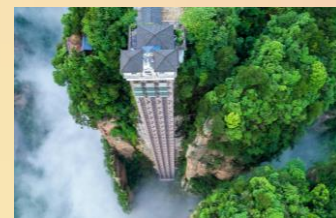
【張家界國家森林公園】

【張家界國家森林公園】：遊覽張家界峰林之王【天子山景區】後乘環保車前往遊覽【袁家界核心景區】《阿凡達》外景拍攝地——哈利路亞山，探尋影視阿凡達中群山漂浮、星羅棋佈的玄幻莫測世界；參觀雲霧飄繞、峰巒疊嶂、氣勢磅礴的空中絕景。山下漫步天然大氧吧【金鞭溪】杉林幽靜，穿行在峰巒幽谷雲間，溪水明淨，人沿清溪行，勝似畫中游。