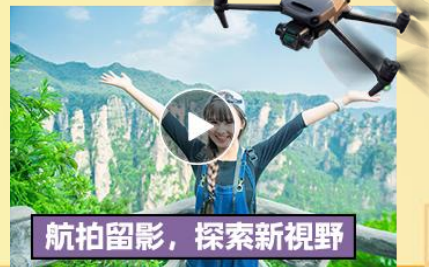
航拍留影，探索新視野