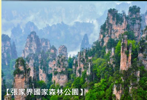
【張家界國家森林公園】