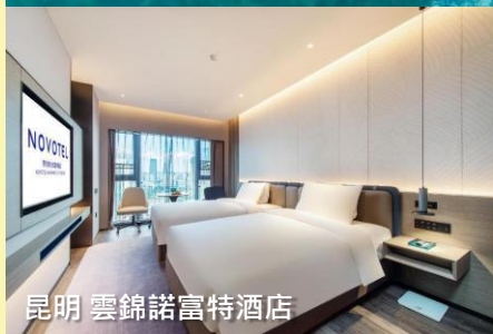
昆明 雲錦諾富特酒店