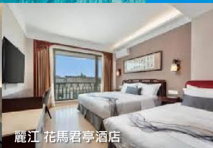
麗江 花馬君亭酒店