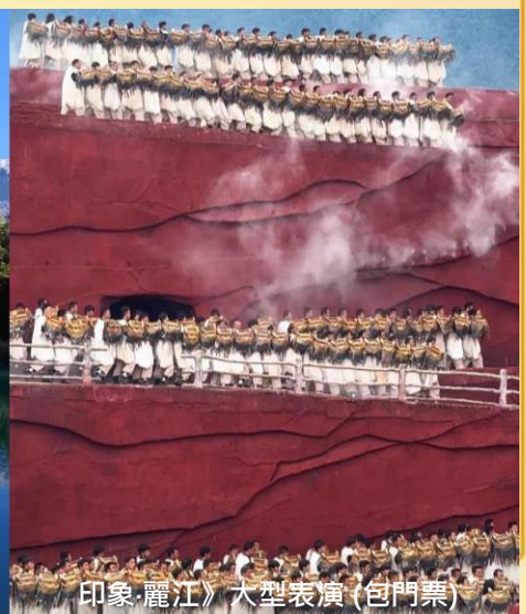
印象麗江大型表演(包門票)