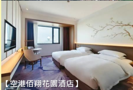
【空港佰翔花園酒店】