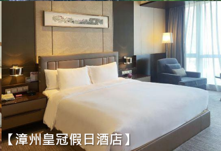
【漳州皇冠假日酒店】