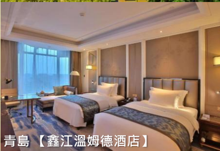
青島【鑫江溫姆德酒店】