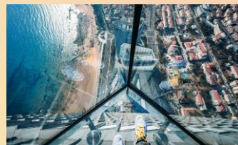
【雲上海天·369M城市觀光廳】

【仙境蓬萊閣】：蓬萊閣坐落在山東省煙台地區的蓬萊市城北海邊的山崖上，始建於宋朝（即公元1070年），距今已有900多年的歷史，它與滕王閣、黃鶴樓、岳陽樓一起並稱中國古代四大名樓。素有仙境之稱的蓬萊，自古便是秦皇漢武求仙訪藥之處。