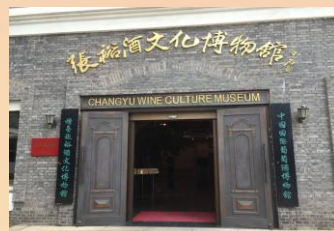
【張裕酒文化博物館】

【張裕酒文化博物館】：以張裕公司一百多年歷史為主線，介紹中國葡萄酒業及中國民族企業崛起的艱辛歷程，是全球葡萄酒行業中為數不多的世界級水平的專業博物館。