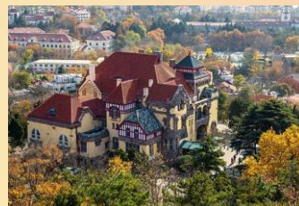
【德國總督府舊址博物館】

【棧橋】：棧橋位於青島中心城區的南部海濱，是一條440公尺長的海上長廊，從陸地延伸入海中。棧橋建於清光緒年間（1892年），已有百年歷史，棧橋曾是青島早期的軍事專用人工碼頭，如今被視為青島的象徵。棧橋盡頭的迴瀾閣，則是青島近代歷史的見證。