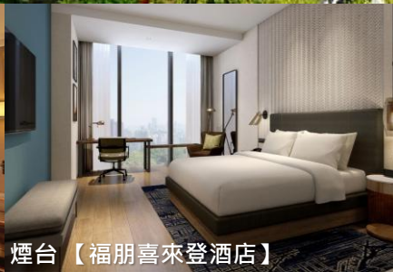
煙台【福朋喜來登酒店】