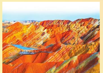
【張掖七彩丹霞景區】

*溫馨提示：張掖至西寧(車程約5.5小時)。 *備註：如遇張掖至西寧段道路封路則改張掖乘坐動車返回西寧，另取消遠觀祁連山雪山，以當天實際情況安排，不做另行通知，敬請諒解!/*賞油菜花期僅供參考，如因天氣/過季則自然遊覽景區，不作任何通知，敬請留意。