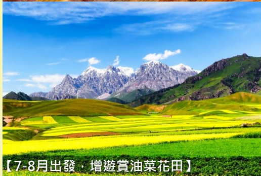
【7-8月出發，增遊賞油菜花田】