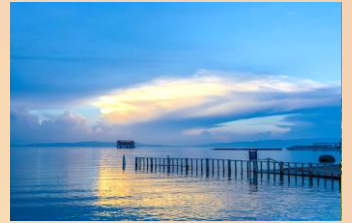
【青海湖二郎劍景區】

【平安驛】：深入展示河湟民俗文化，被形容為「河湟文化博物館」，展現濃郁的青海地域特色。