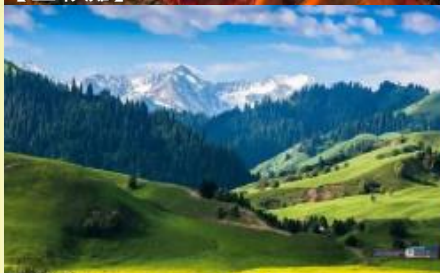
【禾木景區】夏天景色