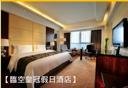
【臨空皇冠假日酒店】