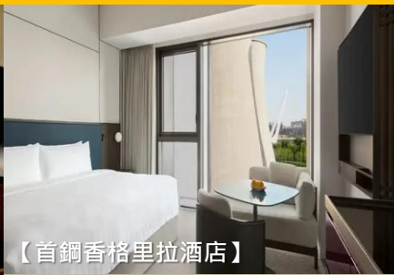
【首鋼香格里拉酒店】