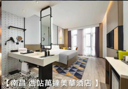
【南昌 西站萬達美華酒店】