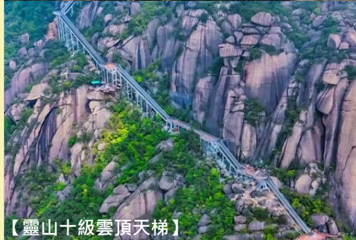
【靈山十級雲頂天梯】