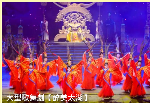
大型歌舞劇【醉美太湖】