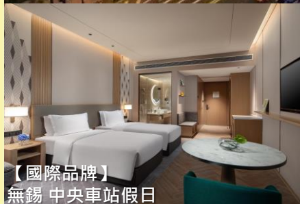
【國際品牌】 無錫 中央車站假日