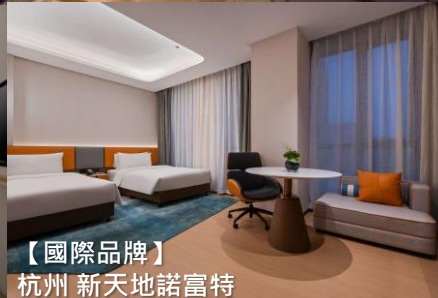
【國際品牌】 杭州 新天地諾富特