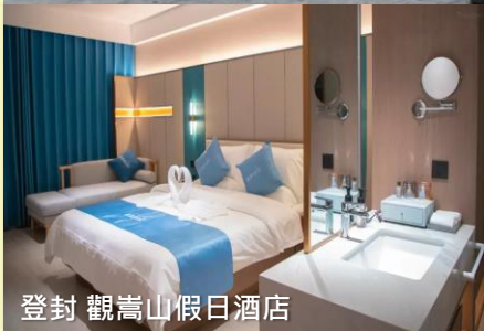
登封 觀嵩山假日酒店