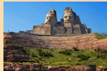
【炎黃二帝巨型塑像】