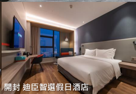
開封 迪臣智選假日酒店