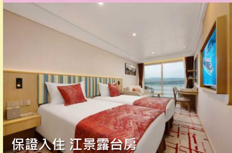
保證入住 江景露台房

三峽五星遊輪【長江如歌號 於2025年10月正式首航】 保證入住三樓以上【江景露台房】(已包船上服務費)