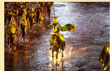
【烽煙三國大型實景演出】

【豐都名山】: 豐都名山以“鬼國京都”聞名於世, 融合道、儒、佛文化精髓, 以“懲惡揚善、唯善呈和”為核心文化理念, 擁有2000餘年歷史, 是道家“三十六洞天, 七十二福地”之一。景區內奈何橋、鬼門關、天子殿等標誌性建築生動演繹幽冥文化, 而鬼城牌坊上蘇軾題寫的“天下名山”及“下笑世上士, 沉魂北豐都”詩句, 更添人文底蘊。