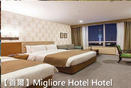
【首爾】Migliore Hotel Hotel