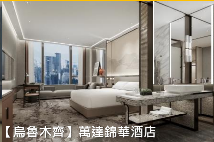
【烏魯木齊】萬達錦華酒店