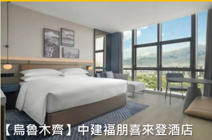
【烏魯木齊】中建福朋喜來登酒店

專業旅運 40周年呈獻，每位勁減500 早報名優惠價 $16,499 起 (*名額有限先到先得)