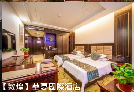
【敦煌】華夏國際酒店