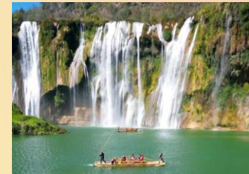
羅平【九龍瀑布景區】

*溫馨提示：興義至九龍瀑布 (車程約1小時)、九龍瀑布至東川樂譜凹 (車程約3.5小時)。/ *如遇暴雨期間，水位上漲，竹筏停航，則改為觀光車往返。