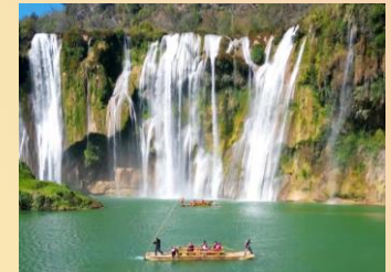
羅平【九龍瀑布景區】

【九龍瀑布景區】：九龍瀑布群，是國家4A級旅遊景區，位於雲南羅平縣城東22公里處，是羅平古十景之一的“三峽懸流”所在地，由於特殊的地質構造和水流的千年侵蝕，在此形成了十級高低寬窄不等，形態各異的瀑布群。一年四季美景不斷，素有“九龍十瀑，南國一絕”的美譽。