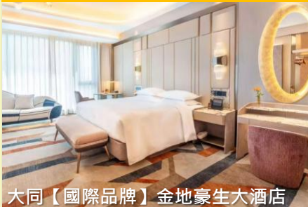
大同【國際品牌】金地豪生大酒店

40周年呈獻，最高勁減高達 $500 早報名優惠價 $7,999 起 (*名額有限先到先得)