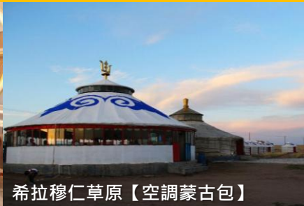
希拉穆仁草原【空調蒙古包】