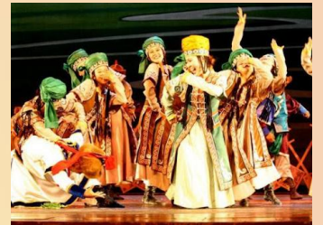
【鄂爾多斯婚禮演出】