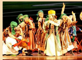
【鄂爾多斯婚禮演出】