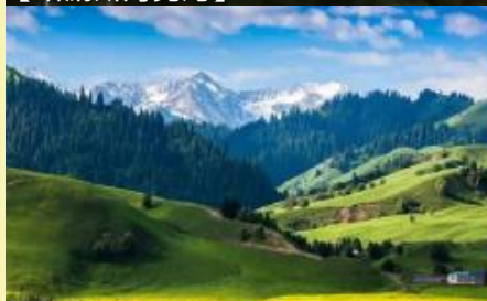
【禾木景區】夏天景色