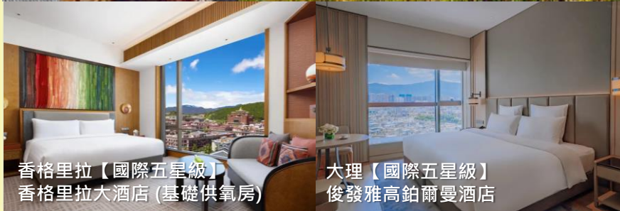
香格里拉【國際五星級】 香格里拉大酒店 (基礎供氧房)