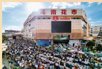
【門南國際花卉市場】