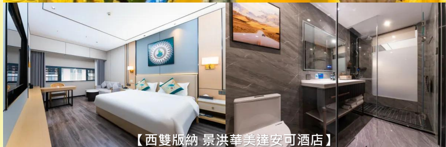
【西雙版納 景洪華美達安可酒店】