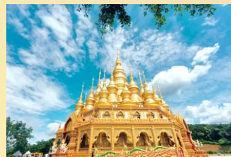
【勐泐大佛寺文化園】

【傣家村寨】:傣家村寨是一個典型的傣家村寨。這裡的房屋是“干欄式”竹樓，每家每戶自成院落。在村寨中可以感受傣族的民俗文化，體驗傣家人的生活。