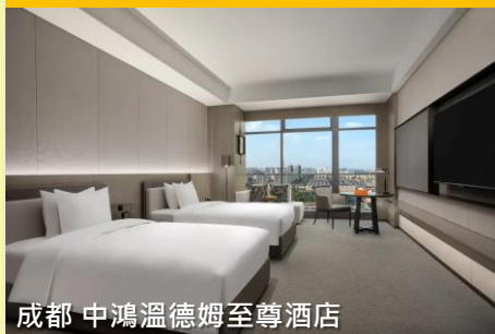
成都 中鴻溫德姆至尊酒店