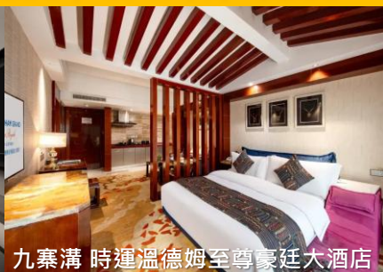
九寨溝 時運溫德姆至尊豪廷大酒店