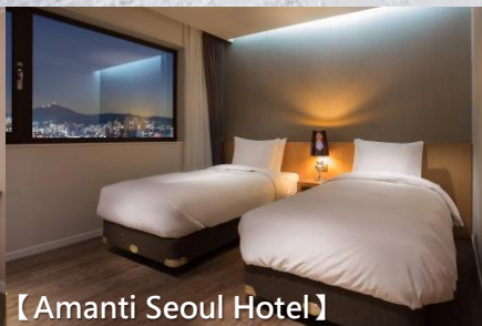
【Amanti Seoul Hotel】