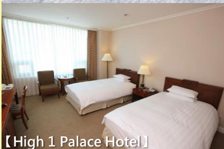
【High 1 Palace Hotel】