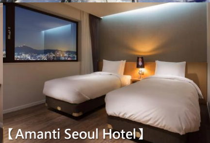
【Amanti Seoul Hotel】