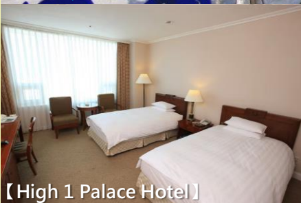
【High 1 Palace Hotel】