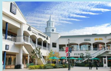
【Rinku Premium Outlets】

【臨空Rinku Premium Outlets】：集結了日本國內及海外知名品牌，以平實的价格就能購買一流名牌商品，店舖數約有250家。