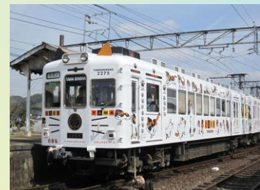
【和歌山貓站長】列車