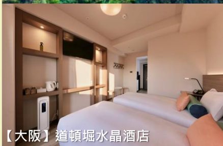
【大阪】道頓堀水晶酒店